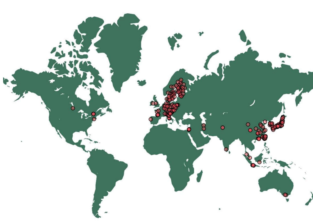
Kuva 1: HPH-jäsenjärjestöjen sijainti

Standardit kehitettiin kansainvälisen HPH-verkoston vision toiminnallistamiseksi ja ensisijaisiin terveystieteisiin liittyvien toimien helpottamiseksi. Vuonna 2006