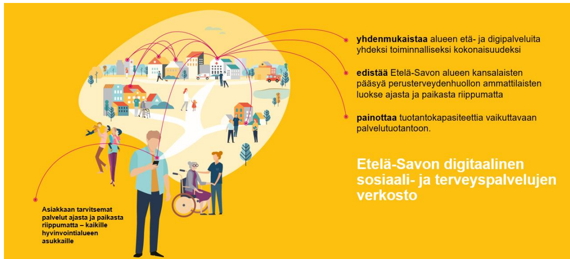
Kuva 1 Etelä-Savon digitaalinen sosiaali- ja terveystalvelujen verkosto

Kuvassa 1 on konseptikuva Etelä-Savon digitaalisesta sosiaali- ja terveystalvelujen verkostosta.